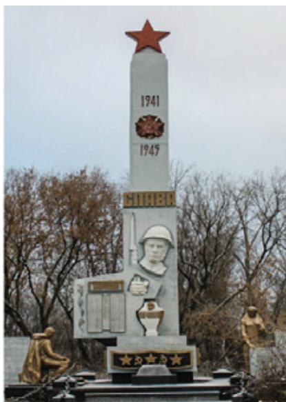
Рис. 1. Обелиск в центре парка с.Нижнее Санчелеево

Для реализации названных целей и задач музей обладает достаточными ресурсами. Для экспонирования музейной коллекции выделено место. Изготовлены столы со стеклом, стенды и прочие атрибуты. В центре музея, на стене, обелиск «Слава героям», посвященный землякам, погибшим на фронтах Великой отечественной войны в точности такой же как находится в парке нашего села Нижнее Санчелеево.