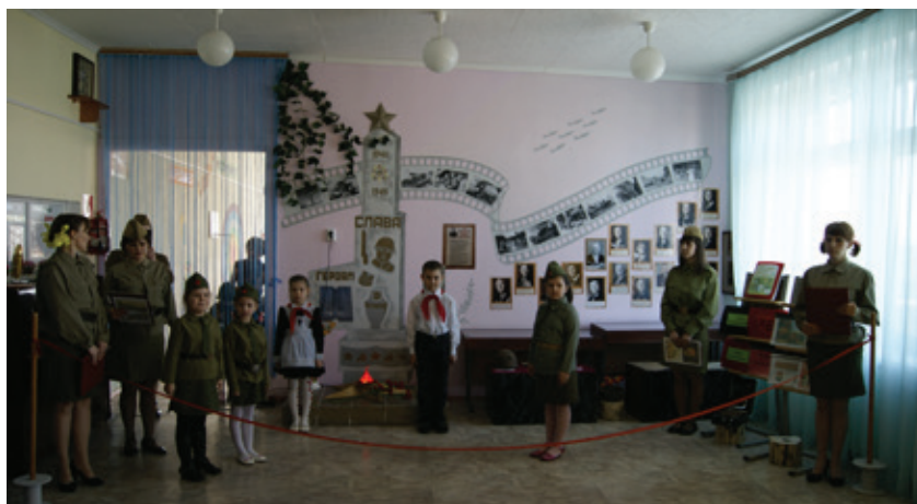
Рис. 2. Музей боевой славы